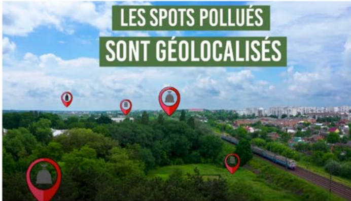
Capture vidéo : Trash Spotter - Le bon goût du plastique... Si on agissait ?/YouTube